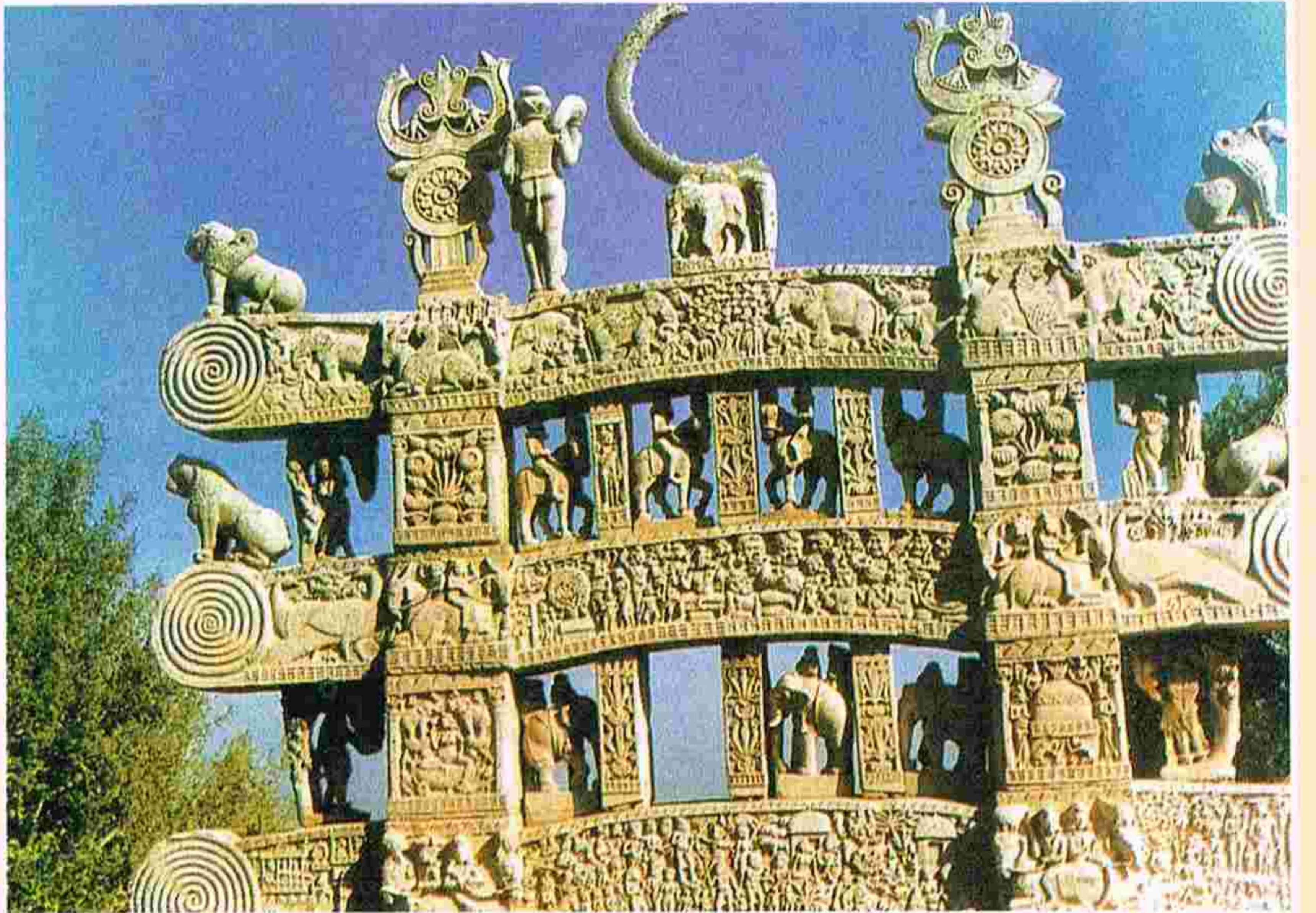
సాంచిలోని బౌద్ధ ఆరామ ఉత్తర ద్వార తోరణం పై సూక్ష్మ కళా నైపుణ్యం