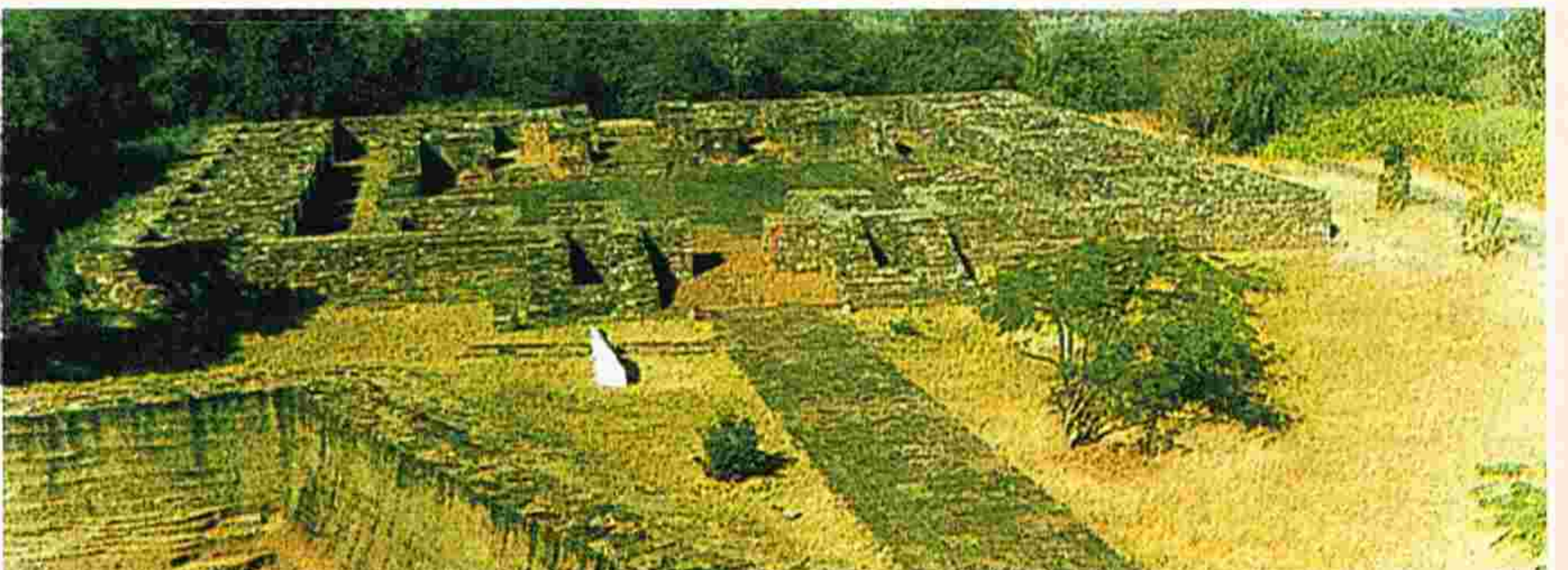
బౌద్ధ గురువు ఆవాసాల శిథిలాలు