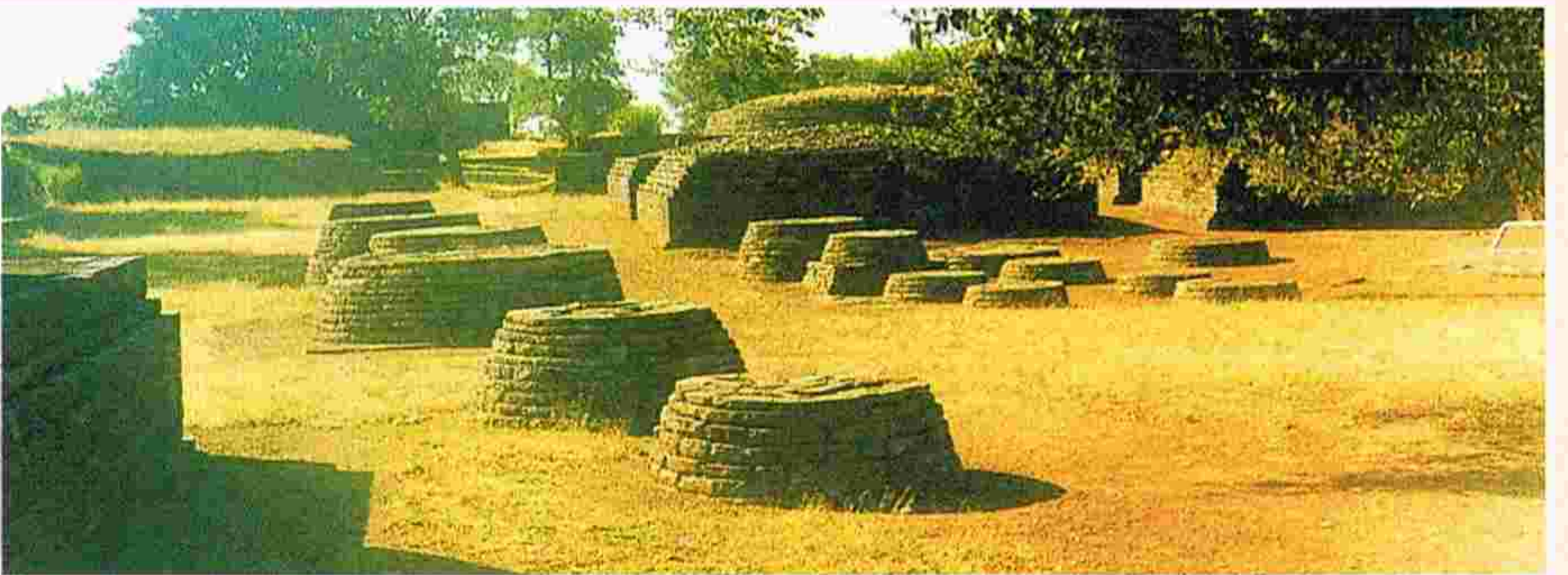
సాంచిలోని మిసీ బౌద్ధ స్థూపాలు