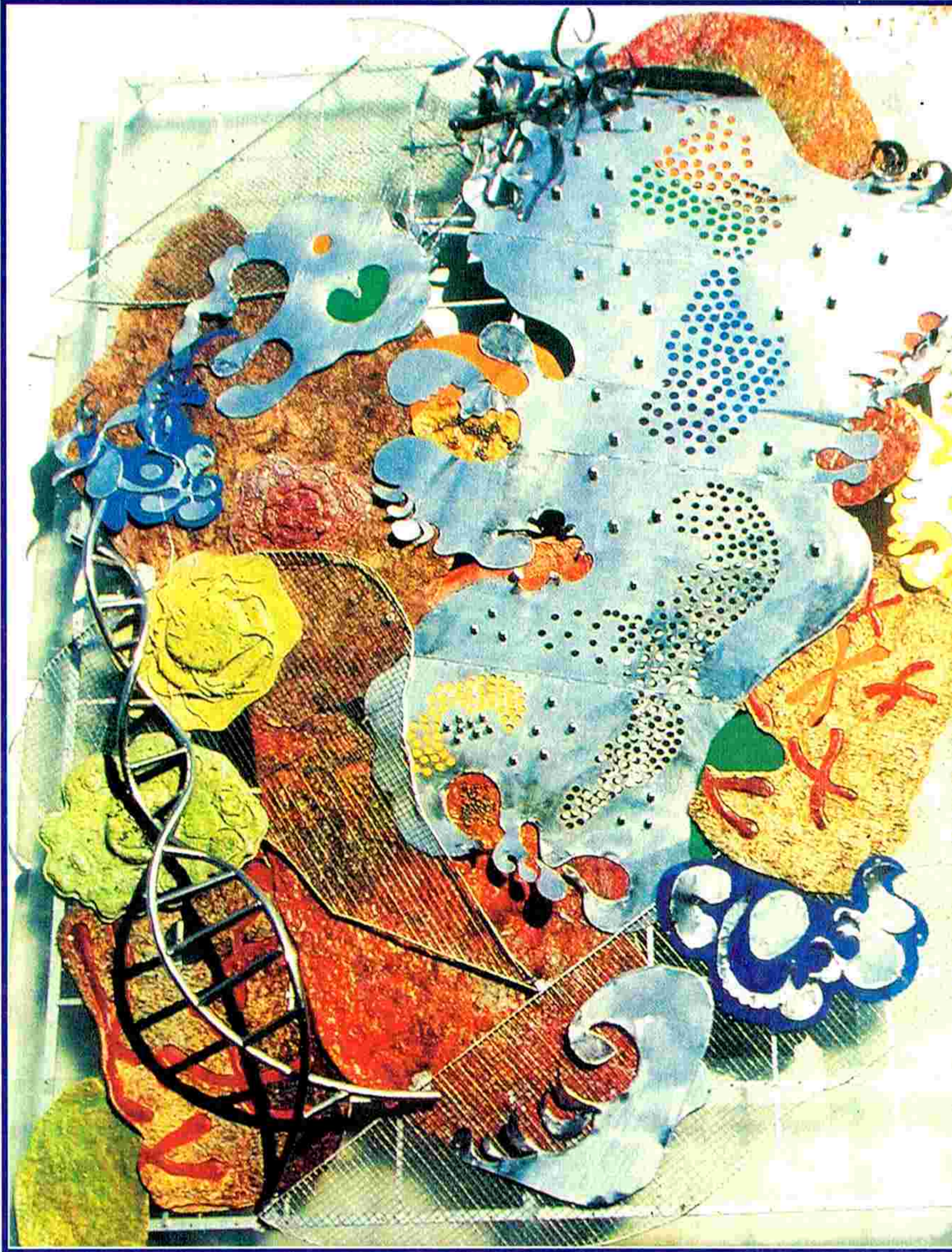
గుప్త భాషా మార్మికతలు