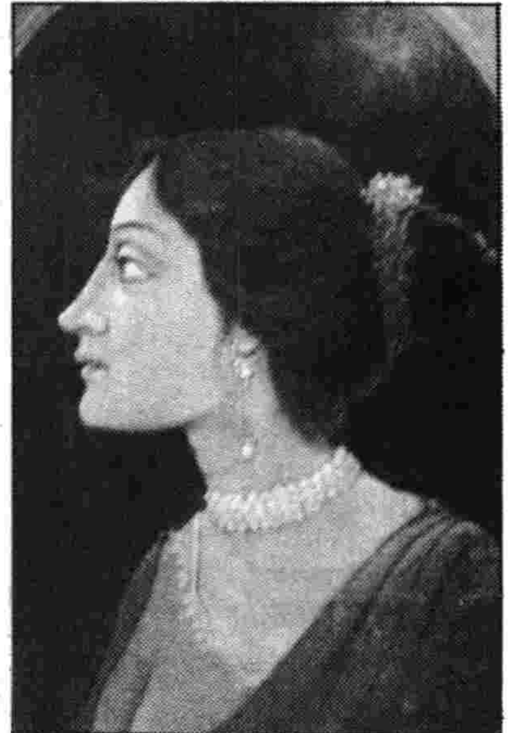
Examples of traditional art at the Birla Academy