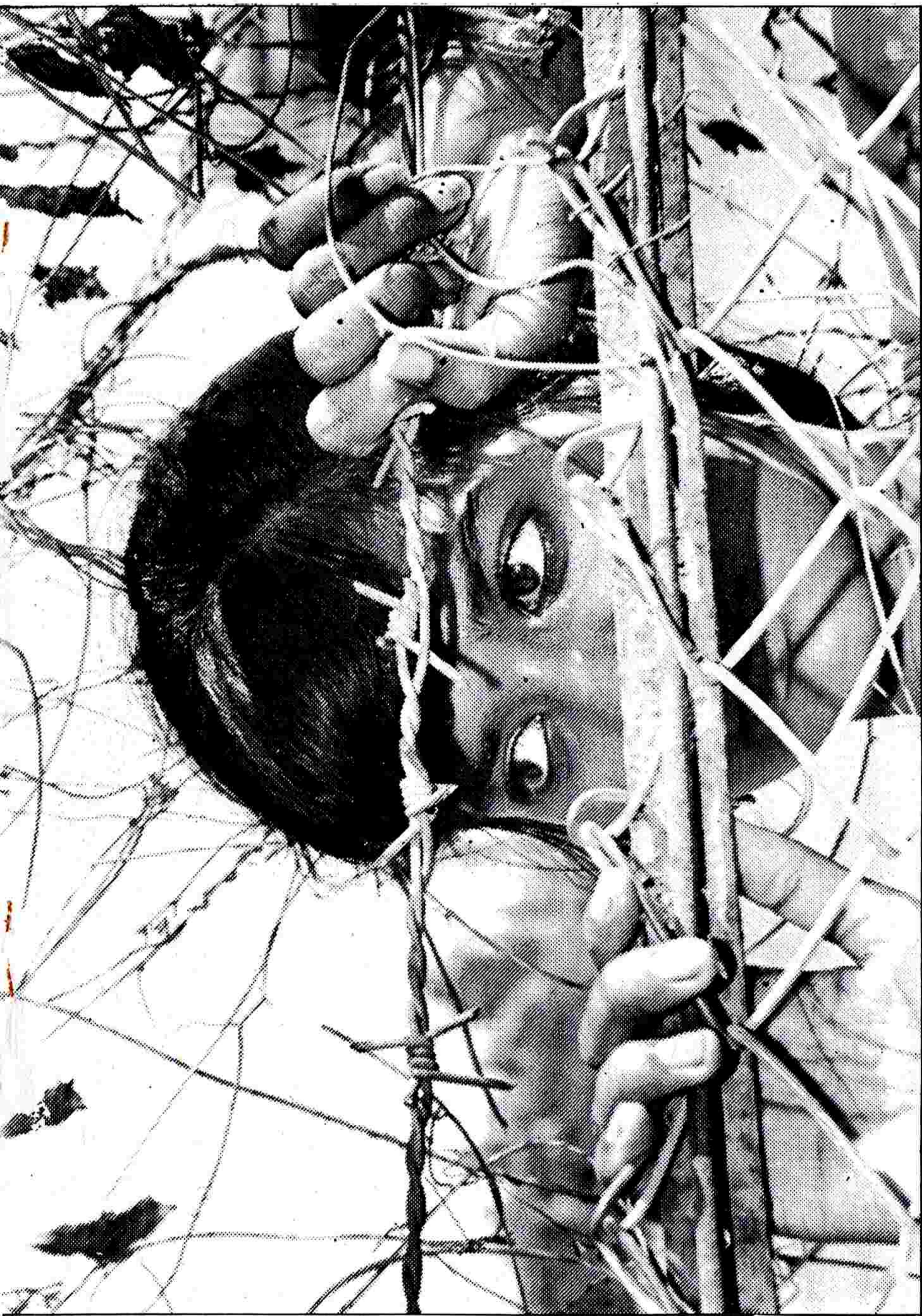
The girl who played Manju in Salaam Bombay! is still on the streets though having been allotted a flat five years ago