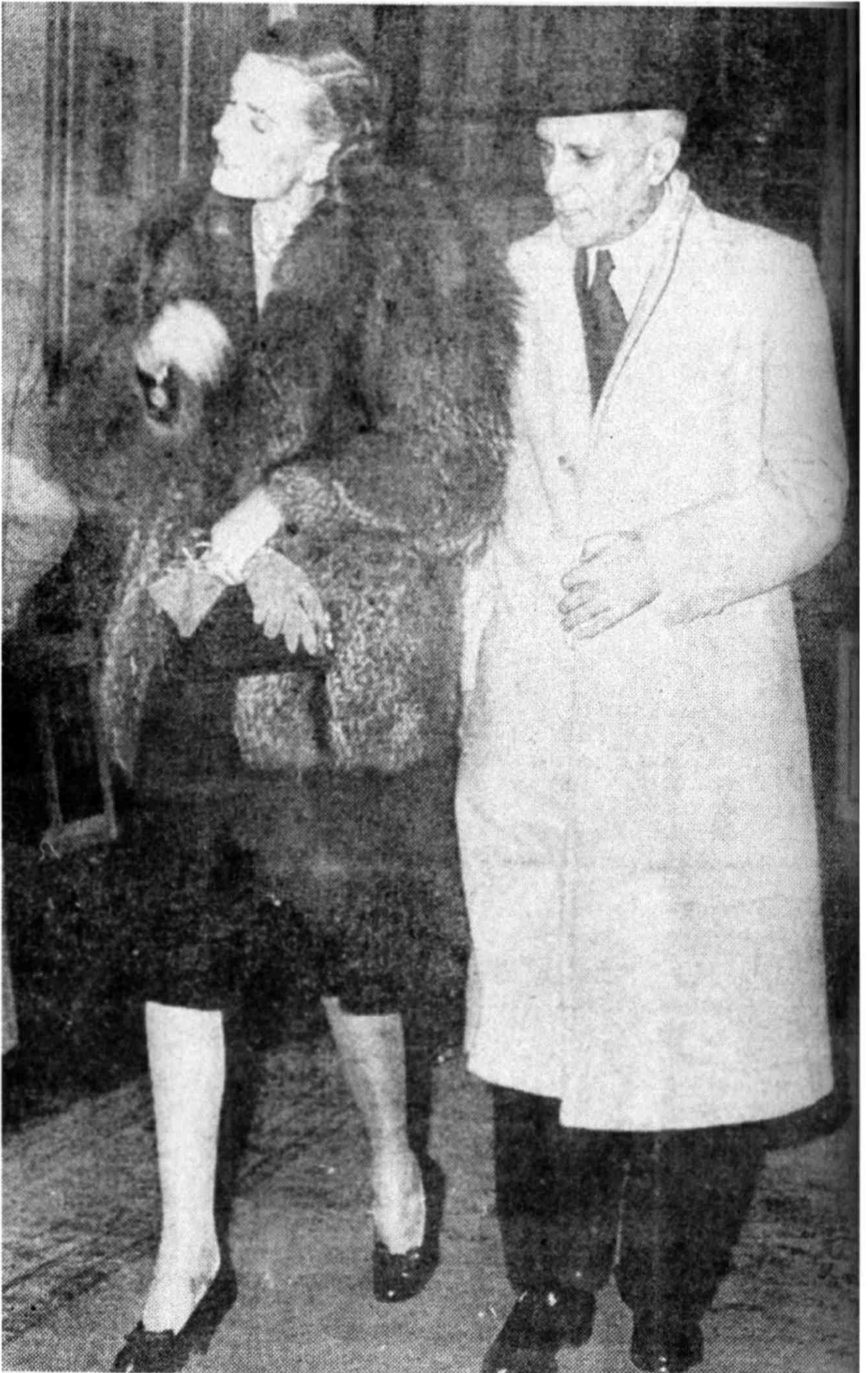
నెహ్రూ - ఎడ్వీన్ లండన్ గ్లోబ్ థియేటర్లో