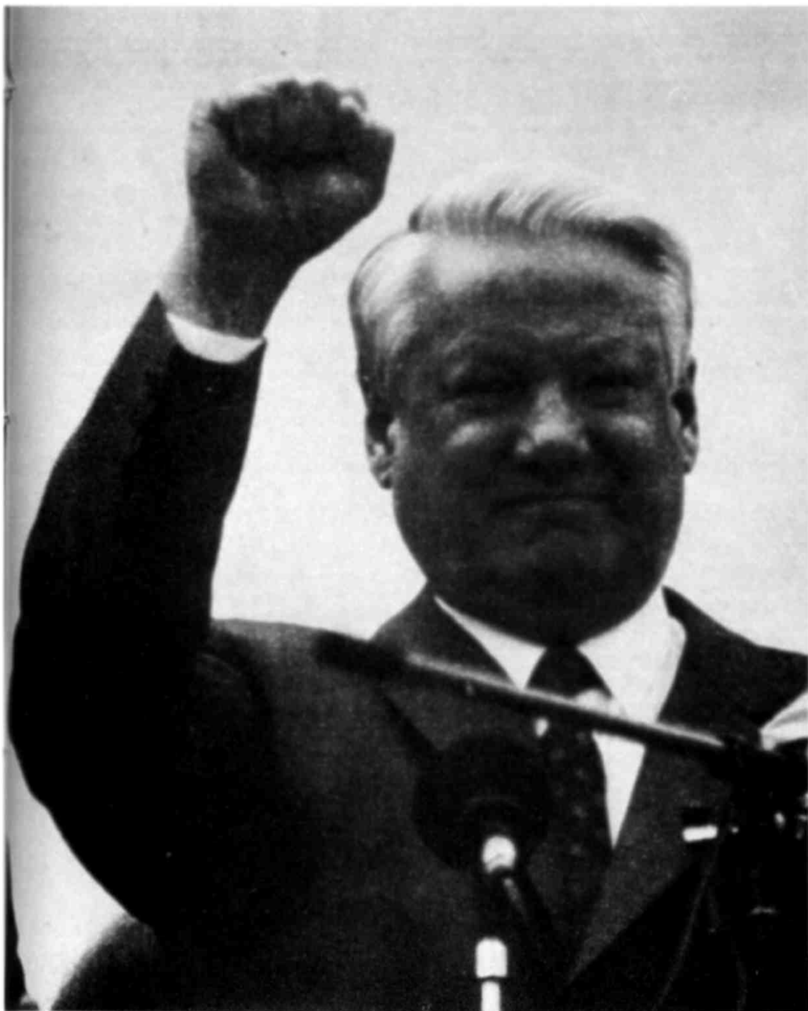
రష్యన్ ప్రెసిడెంట్ బోరిస్ ఎల్సిన్