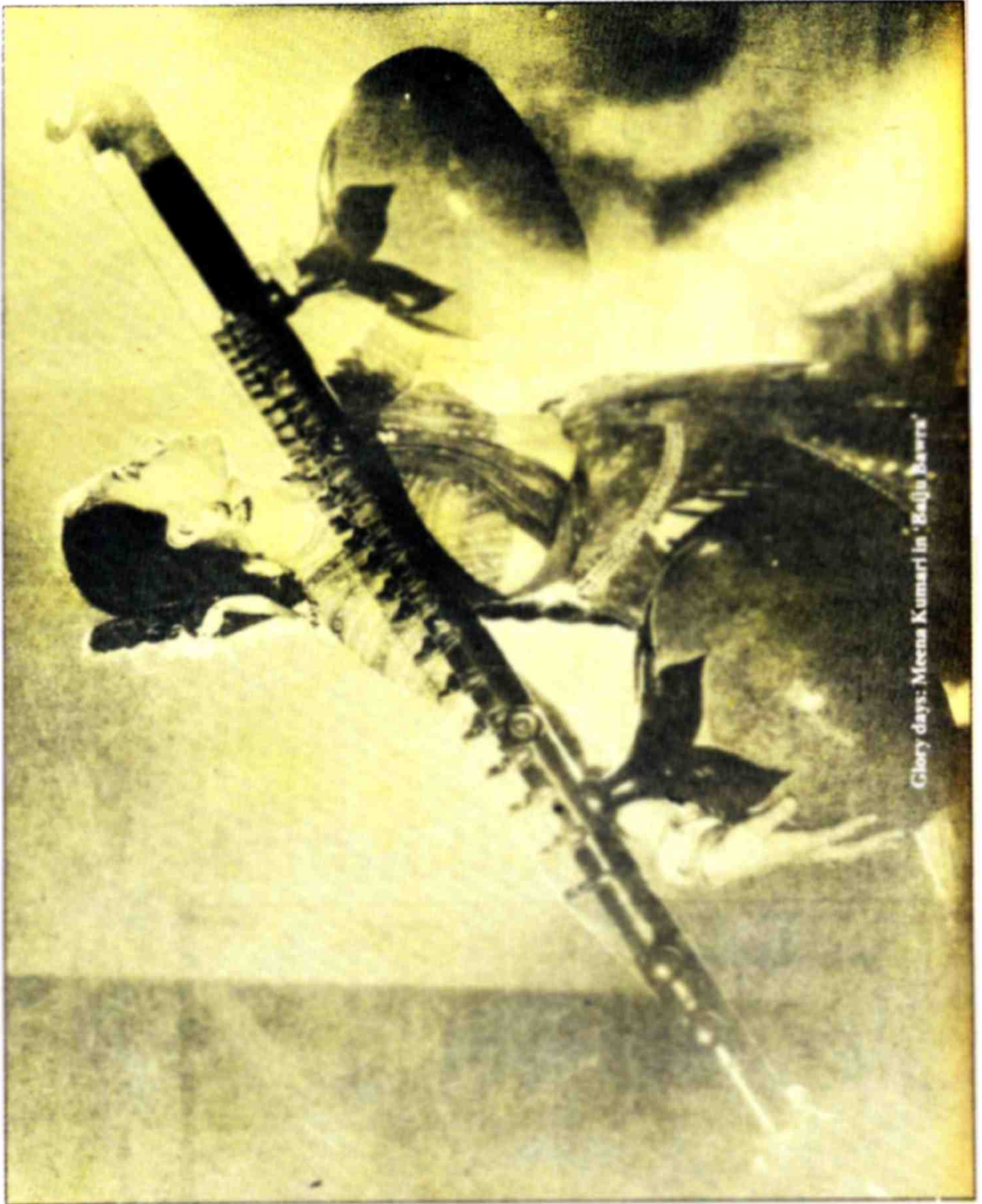
Glory days: Meena Kumari in 'Bajjo Bawra'